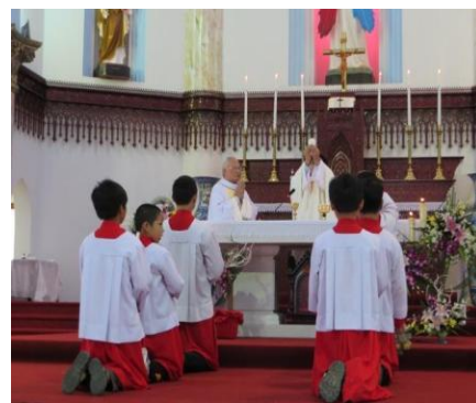
Chầu Thánh Thể và Thánh Lễ Đồng Tế được cử hành trọng thể tại trung tâm kính Lòng Thương Xót Chúa