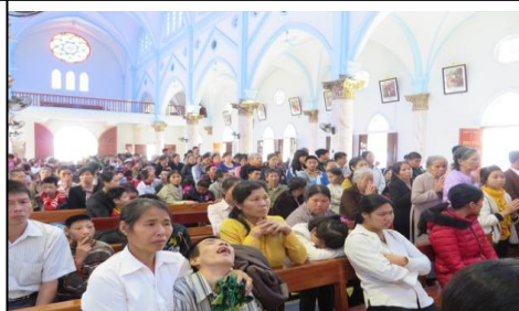
Quà trên tay, bữa ăn ngon miệng, dự lễ sốt sắng . Đó là đặc điểm của ban tổ chức Trung Tâm kính Lòng Thương Xót Chúa