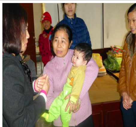
Khi cha mẹ các em toan tính loại bỏ - Lại có những những tâm hồn cao thượng tận tình thương cứu