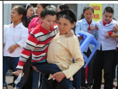
Những người tàn phế đã được mang đến cùng hiệp dâng Thánh Lễ trong biển cỏ trọng đại này