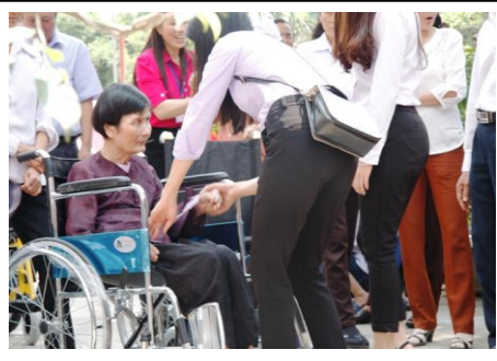
Những người đau yếu khuyết tật tỏ ra vui mừng khi đón nhận món quà quý giá của các ân nhân Vagsc